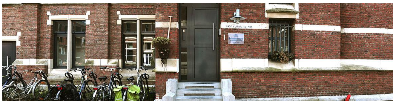
Obrázek č. 19: Vertrouwenscentrum v Antverpách